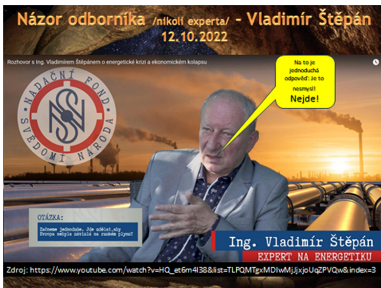
Obrázek 1: OTAZKA: Začneme jednoduše. Jde udělat, aby Evropa nebyla závislá na ruském plynu? ODOPOVĚĎ: Na to je jednoduchá odpověď: 'Je to nesmysl! Nejde!'